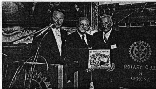
Un momento dell'incontro fra il Rotary di Gemona e quello di Ried.

Questi incontri ribadiscono, superando le barriere della difficoltà a comunicare a causa della scarsa conoscenza delle lingue, l'assoluta volontà di affermare il principio che è il motivo dominante del Rotary: l'amicizia.