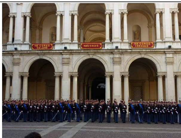
Lo schieramento degli allievi 2012