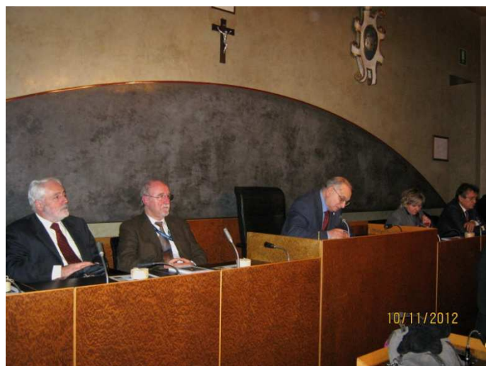
La giuria del concorso

che si terrà Sabato 10 novembre 2012 alle ore 18,00 presso la sala consiliare di Palazzo Botton a Gemona del Friuli