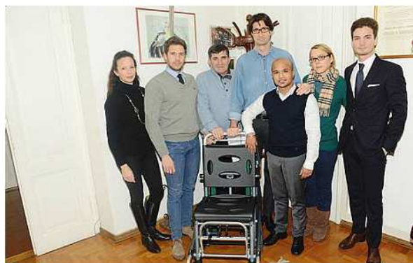
Il momento della consegna del nuovo supporto per trasporto disabili alla Cri

Consegnato il nuovo supporto frutto dell'impegno della sezione Udine Nord-Gemona