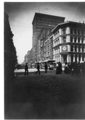
Costruito nel 1897 su progetto dell'architetto C. J. Warren, l'Unity Building fu, con i suoi 17 piani, l'edificio più alto di Chicago fino alla sua demolizione nel 1989. Le due foto risalgono entrambe ai primissimi anni del '900

Nell'ufficio di Gus trovarono anche un suo amico, Hiram Shorey. Dopo alcuni convenevoli Paul presentò il suo progetto di un Club che sarebbe poi diventato il Rotary