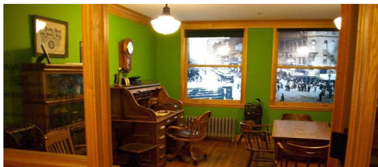
L'ufficio di Gus Loehr

Prima della demolizione dell'Unity Building nel 1989 tutti i mobili e tutti gli arredi dell'ufficio furono salvati e poi riutilizzati nella sua attuale fedele ricostruzione al 16° piano della sede del Rotary International a Evanston, Illinois.