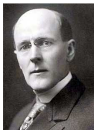
Paul Harris, avvocato (1868-1947)