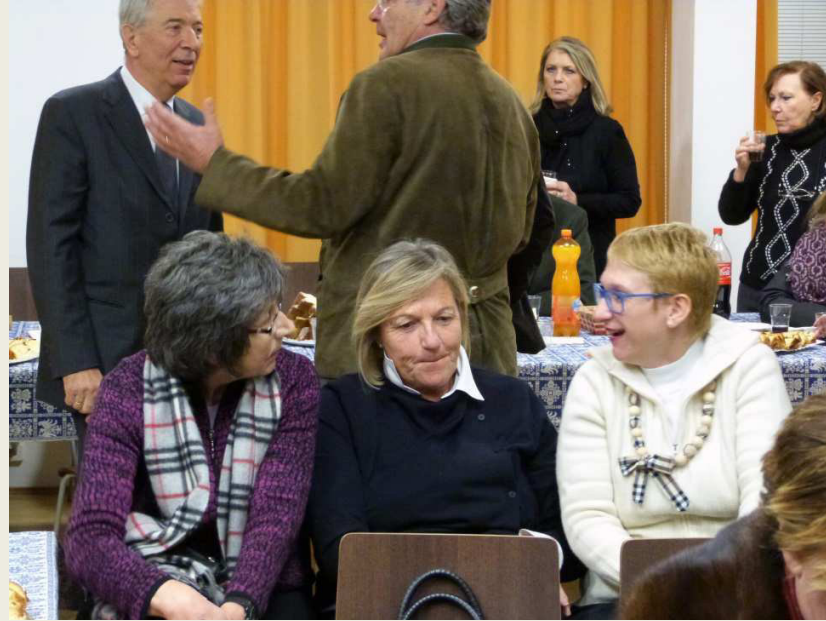
Incontro al Rotary club di Rovereto