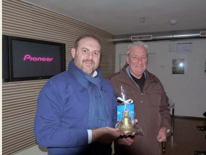
Scambio di omaggi