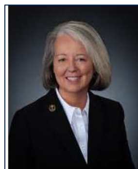
Susan C. Howe RC Space Center (Houston) Texas, USA